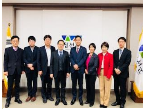
左から4人目が副郡主