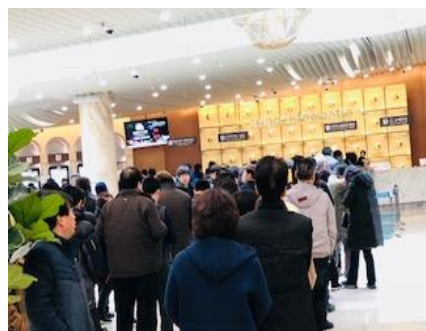
開店前に並ぶ人たち

カジノ施設のすぐそばに「賭博中毒管理センター」があり、予防・相談・治療 再発防止・リハビリ再発支援を専門の職員が対応します。朝から、10台ほどのテーブルに相談する人たちがいました。その隣で、12時の開店を待ってロビーに200人程度の人が並んでいる状態です。ゲーム規制やギャンブル依存症の対応があり、すぐそばにカジノがある光景は不思議に映りました。