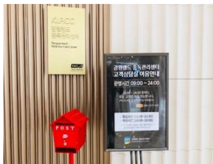
賭博中毒管理センターと対応して下さった職員