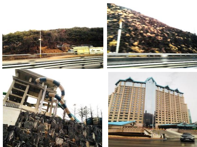
ウォーターパークやホテル

カジノが開かれる12時前に内部を視察しました。(中は写真撮影禁止)。面積12,793㎡(3,870坪)、180台のテーブルと1,360台のスロットマシンを有していますが、来場者は、シーズン中は一日10,000人、シーズンオフでも7,000人の入場があるため、テーブルの取り合い(売買)が行われないように規制がかけられています。