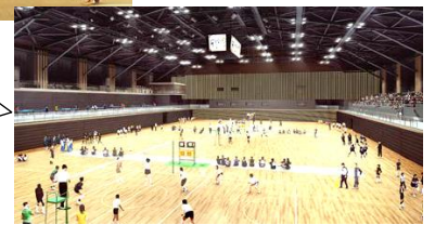
2階アリーナ イメージ