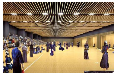
1階武道場 イメージ

横浜文化体育館(9月まで活用)を跡地活用する「メインアリーナ」と、横浜総合高校跡地等を活用した「サブアリーナ」の建設が進められています。7月24日にサブアリーナが「横浜武道館」として開館しました。1階には約500席の武道館、2階には約3,000席のアリーナが設置され、最新の設備が導入されています。横浜スタジアムを含めて関内・関外地区のスポーツ・イベントの活性化に大きく期待できる場所です。