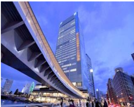
市庁舎ライトアップ(青と黄色)とウクライナ難民支援募金活動

第1回市会定例会最終日に次の決議が全会一致で採択されました。また、立憲民主党は各地でウクライナ難民支援募金のお願いをしています。